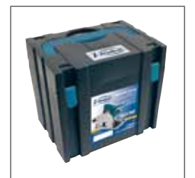
Maletín de transporte incluido. Maletí de transport inclòs.