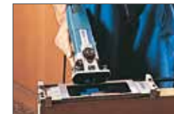
Colocación en la puerta. Col·locació a la porta..