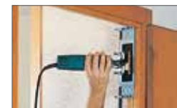
Colocación en el marco. Col·locació al marc.

155,00 € RAEE: 0,40 € IVA: 27,90 € TOTAL 183,30 €