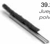
39.2068.0 Juego felpa para polvo (opcional)

Está diseñado para dividir ambientes a través de dos paneles de madera correderos enfrentados con apertura sincrónica permitiendo deslizar las hojas de manera simultánea. Sistema moderno e innovador con apertura a 180° para conseguir apertura hasta 2,5 m. Perfil de aluminio anodizado con acabado "silver" (AA10 ISO 7599, 10 micras). Galería clipada para una instalación rápida. Regulación en altura de la puerta. Sujeción de puertas de madera hasta 85 Kg. Espesor mínimo 30mm hasta 45mm. Rodamientos de bolas KLEIN® para apertura suave e eficiente. Sistema de correa premontado y pretenso para un montaje rápido. Instalación a pared y a techo.