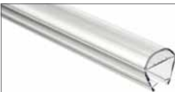
39.1330.4 Junta salvacantos

Para un correcto funcionamiento del sistema, las medidas de la hoja deben seguir las pautas aconsejadas de mínimo y máximo de ancho y alto especificadas en la tabla.