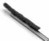
39.2068.0 Juego felpa para polvo (opcional)

Para un correcto funcionamiento del sistema, las medidas de la hoja deben seguir las pautas aconsejadas de mínimo y máximo de ancho y alto especificadas en la tabla.