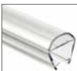
39.1330.4: Junta salvacantos