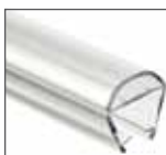
39.1330.4: Junta salvacantos