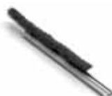
39.2068.0 Juego felpa para polvo (opcional)

Para un correcto funcionamiento del sistema, las medidas de la hoja deben seguir las pautas aconsejadas de mínimo y máximo de ancho y alto especificadas en la tabla.