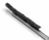
39.2068.0 Juego felpa para polvo (opcional)

Para un correcto funcionamiento del sistema, las medidas de la hoja deben seguir las pautas aconsejadas de mínimo y máximo de ancho y alto especificadas en la tabla.