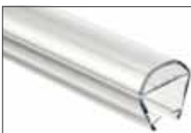
39.1330.4 Junta salvacantos