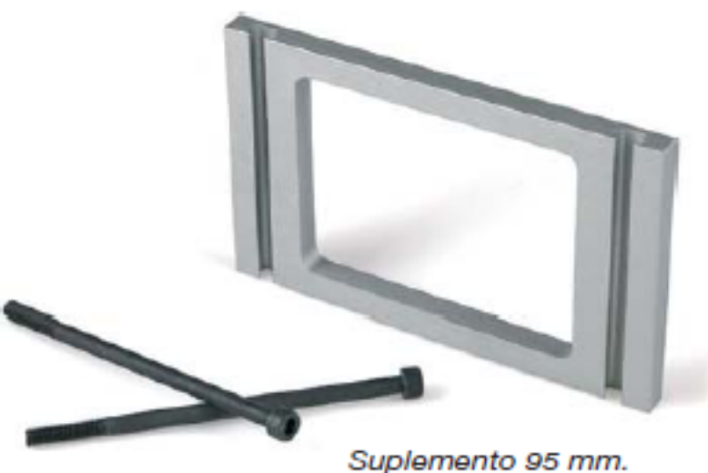
Suplemento 95 mm.