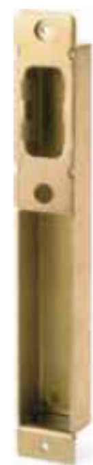
Cajetín V Antipalanca

Incorpora como novedad un sistema antipalanca que protege eficazmente del retroceso forzado de los bulones centrales de cierre mediante el Cajetín V.