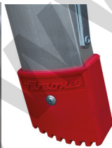
Taco. (2 unidades).