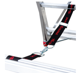
Juego de cintas de seguridad.