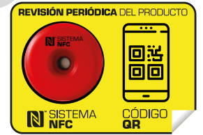
NFC Nuevo sistema de revisión del producto.