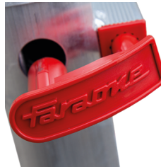
Tope. (2 unidades).