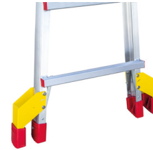
Conjunto de estabilizadores para TELES.