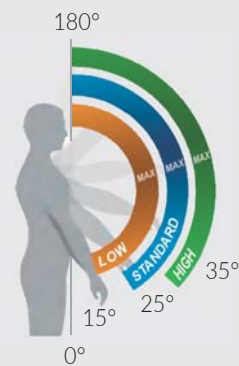
Zona de activación

Ajuste rápido y sencillo del ángulo a partir del cual comienza la asistencia. El soporte actúa de forma progresiva en tres zonas de activación, adaptándose con precisión a cada tarea y a las necesidades del operario.